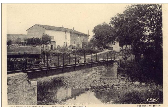
La passerelle en 1925.

9) Arrivée au hameau de Valuisant, prendre la route de Rochefort au croisement sur la droite. A 10 mètres, tournez à gauche et prenez la passerelle qui vous permettra de revenir en direction du quartier de la gare. Cette passerelle fut construite en 1923 sous le mandat de Lucien Genty afin de remplacer un ancien passage à gué. Le montant des travaux s'élève alors à 10 000 francs. Cette passerelle sera l'objet de travaux de remise en état en 2009. Une pile sera construite afin de soutenir le tablier. Une fois la passerelle franchie, vous poursuivez sur un chemin de terre qui était autrefois l'unique accès reliant Cormorand la gare aux hameaux de Valuisant. En effet, la route pour aller à Simandre ne fut construite qu'entre 1843 et 1848. Attention à la circulation, vous longez de nouveau la RD 42 sur 300 mètres.