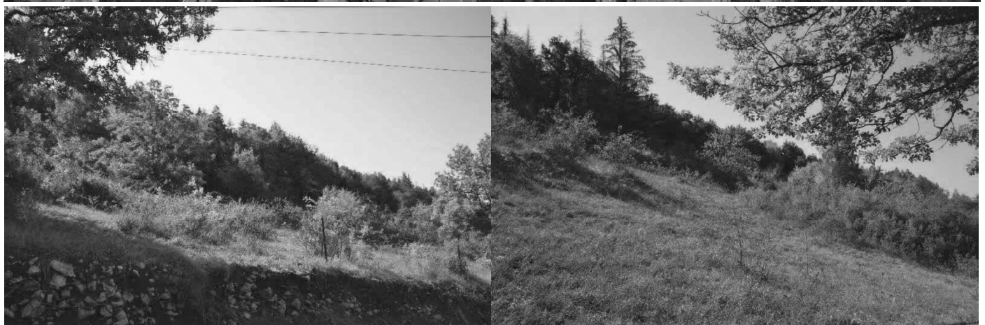
Pelouses sèches à Sous la Roche dans le site Natura 2000 (photo de gauche) et hors site Natura 2000