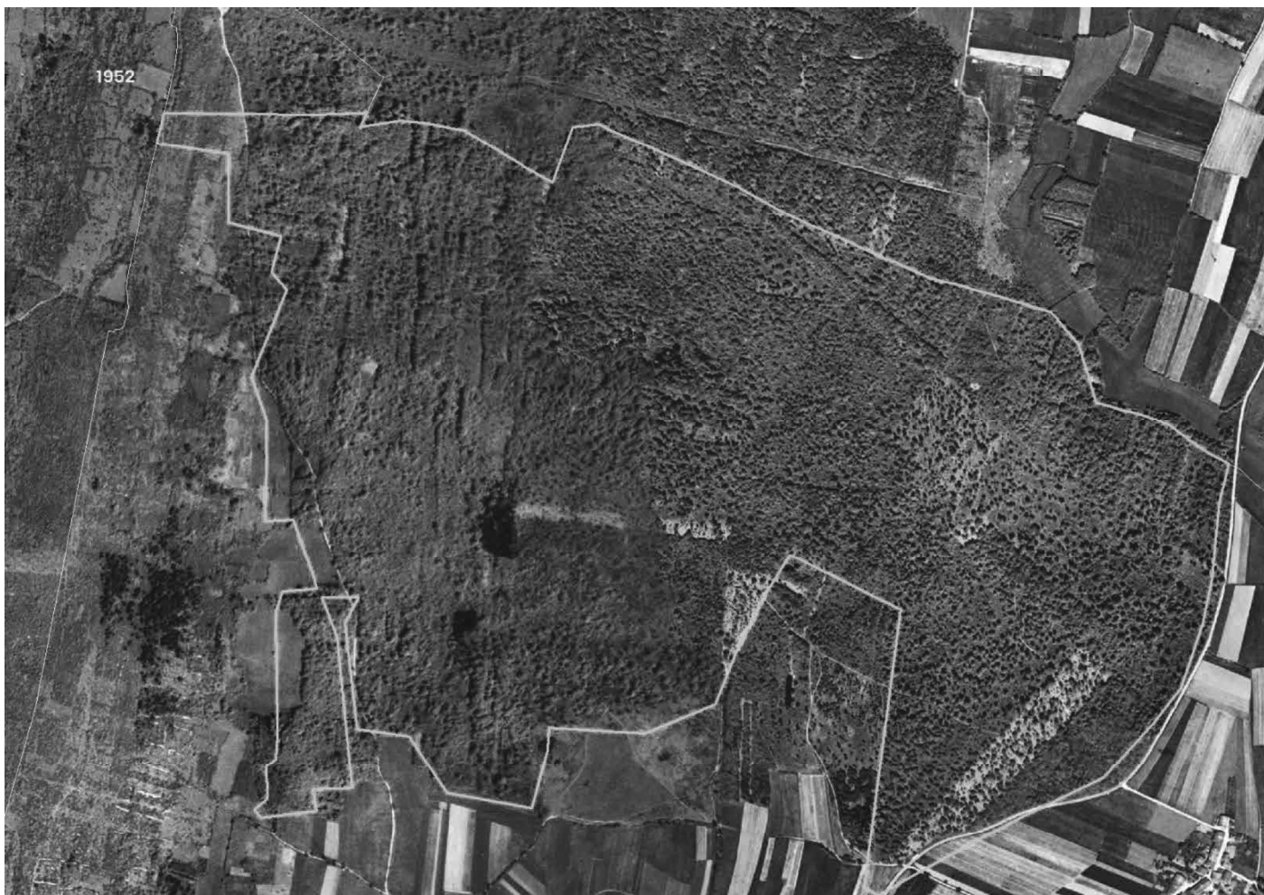
Analyse diachronique à Valuisant (haut) et aux Renons (bas) avec limite en vert des forêts des cartes d'état-major (1952)