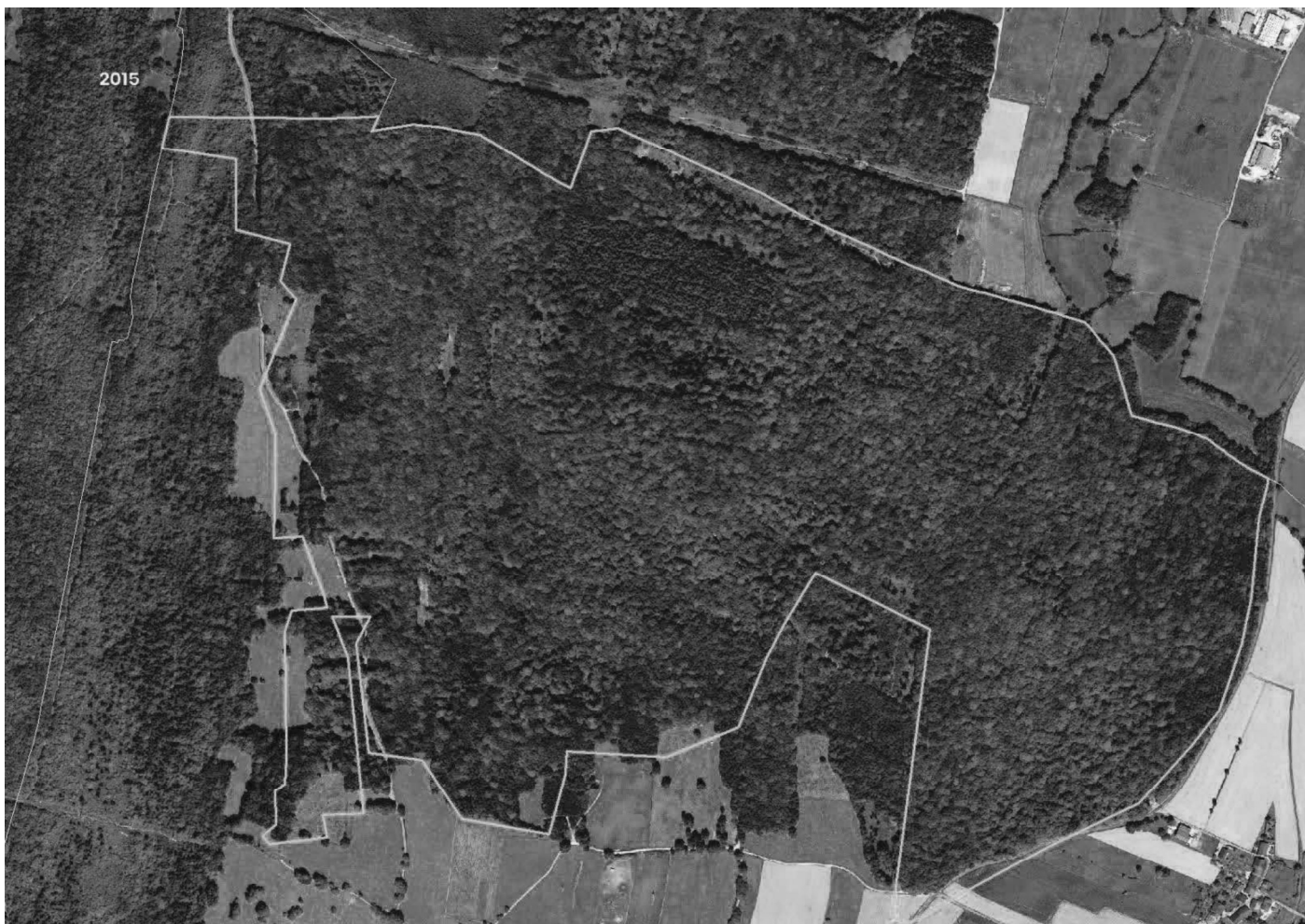
Analyse diachronique à Valuisant (haut) et aux Renons (bas) avec limite en vert des forêts des cartes d'état-major (2015 et 2012)