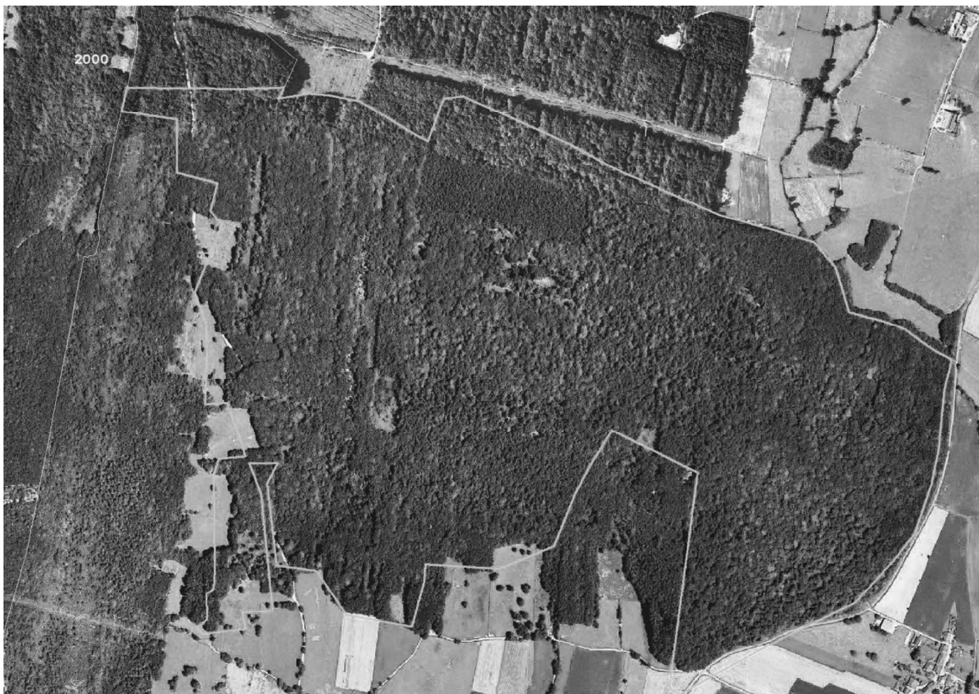
Analyse diachronique à Valuisant (haut) et aux Renons (bas) avec limite en vert des forêts des cartes d'état-major (2000)