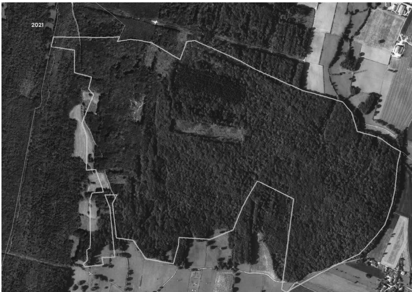
Analyse diachronique à Valuisant (haut) et aux Renons (bas) avec limite en vert des forêts des cartes d'état-major (2021)