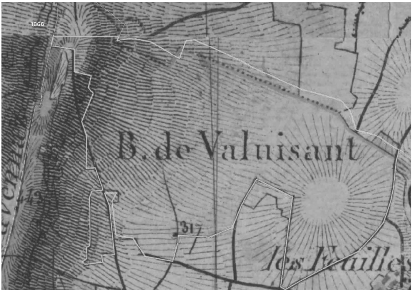
Analyse diachronique à Valuisant (haut) et aux Renons (bas) avec limite en vert des forêts des cartes d'état-major (1866)